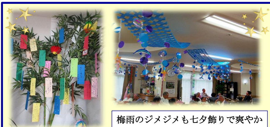
梅雨のジメジメも七夕飾りで爽やか